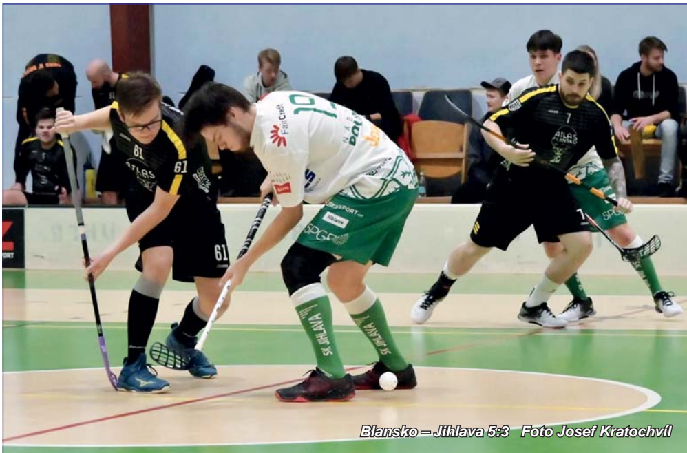
Blansko – Jihlava 5:3