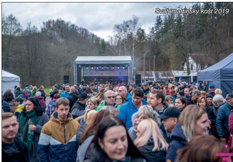
Svatomartinský košt 2019