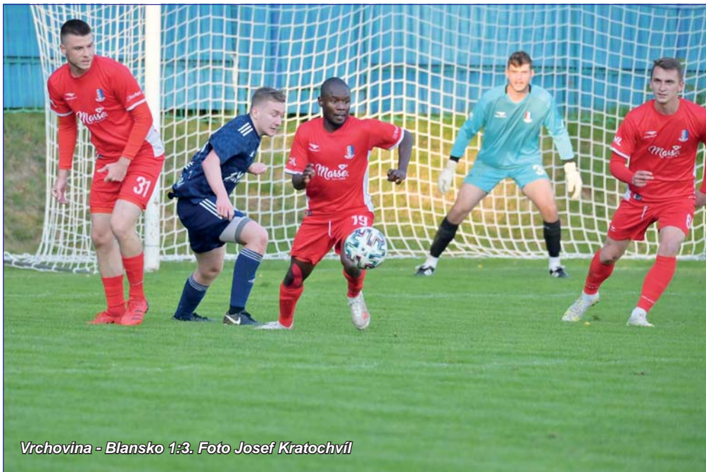
Vrchovina - Blansko 1:3.

Nahoru dolů. Velmi zjednodušeně by se tak dala nazvat současná výkonnost blanenských fotbalistů. Nejprve dokázalo nevidanou gólovou smršť během několika minut zvrátit nepříznivě se vyvíjející duel v Novém Městě. Na domácí půdě pak po nemastném neslaném výkonu odevzdalo všechny body béčce prvoligového Slovácka. Na hřišti posledních Otrokovců pak znovu naskočilo na vítěznou vlnu a s přehledem vyhrálo. V tabulce pak týmu trenéra Petra Vašíčka patří nadále lichotivá šestá příčka.