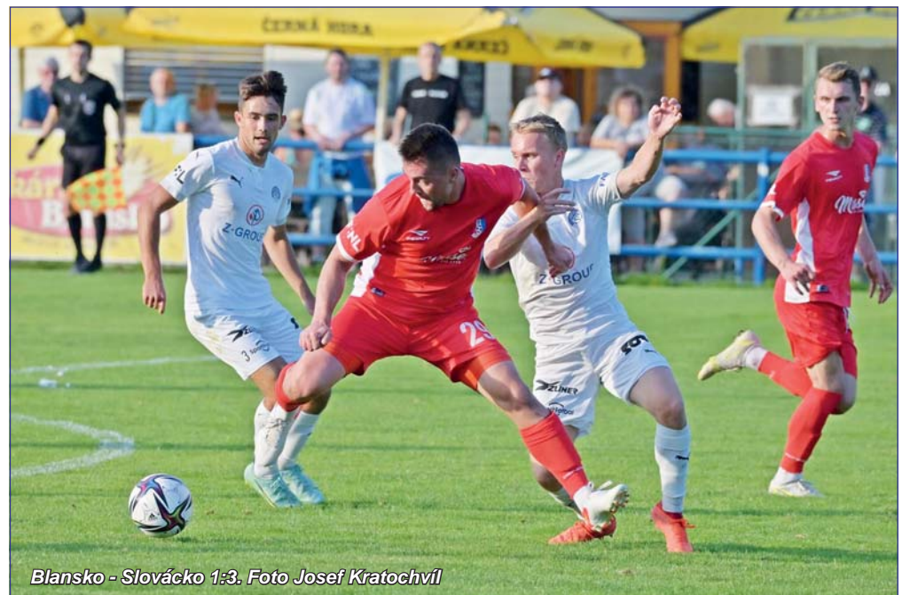
Blansko - Slovácko 1:3.