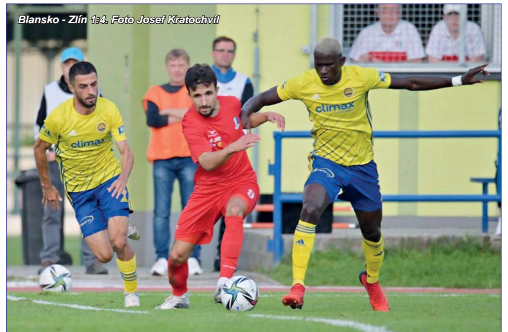
Blansko - Zlín 1:4.

Středeční fotbalový svátek nezklamal. Prvoligový soupeř ze Zlína ve 3. kole MOL Cupu nalákal do Blanska velmi slušnou návštěvu. Diváci neodcházeli zklamani. Domácí hráči svým sympatickým projevem byli favoritovi velmi důstojným soupeřem. Výsledek vypadá jasně, neodpovídá ale průběhu utkání. Blanenští prohráli, jak se říká, se vztyčenou hlavou.