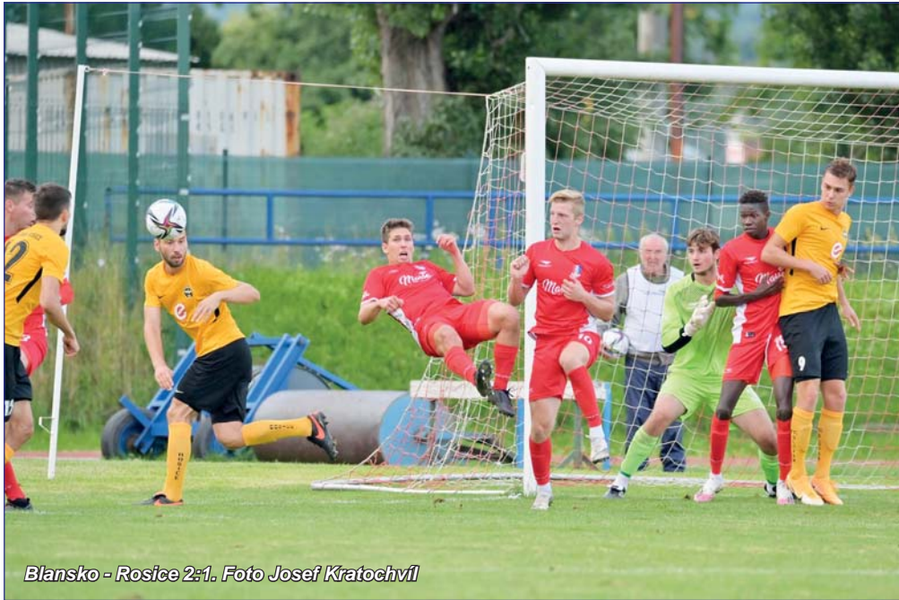
Blansko - Rosice 2:1.

Další anglický týden mají za sebou blanenští fotbalisté. Nejprve dokázali na domácím hřišti zdolat ambiciózní celek z Rosic, který se pod vedením Michala Kuglera netajil tím, že přijel do Blanska vyhrát. Ve středu se před dobrou pětistovkou diváků pustili nebojácně do hráčů prvoligového Zlína. Zápas skončil jejich možná krutou porážkou, všichni přítomní ale uznale pokyvovali hlavami nad jejich výkonem. Čtyři branky pak inkasovali v neděli od rezervy dalšího prvoligového celku – Baníku Ostrava. Ta byla podle očekávání v reprezentační pauze posílena i fluktuanty z prvního mužstva a třemi rychlými brankami v prvním poločase rychle rozhodla utkání.