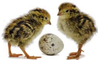
KŘEPELČÍ VAJÍČKA Z NEBESÍČKA +420 602 786 025

* Věnuji za odvoz dětské pískoviště dřevěné rozměr 150x150x30 cm. Tel. 606279387.