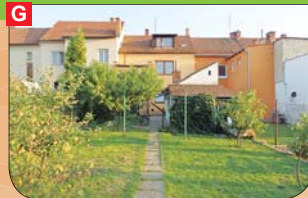
Část rekonstrukce, zahrada, sklep. cena: u makléřky tel: 775 582 092