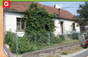
Možnost půdní vestavby, podsklepeno. cena: 400.000,- Kč tel: 775 246 549