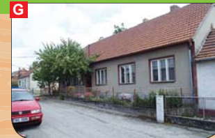
Klidné místo, technický stav dobrý. cena: 1.100.000,- Kč tel: 775 246 549