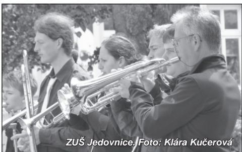
ZUŠ Jedovnice.

V rámci Blanenského kulturního léta se každou nedělí dopoledne od konce června do 1. září konaly před blanenskou radnicí promenádní koncerty. Po