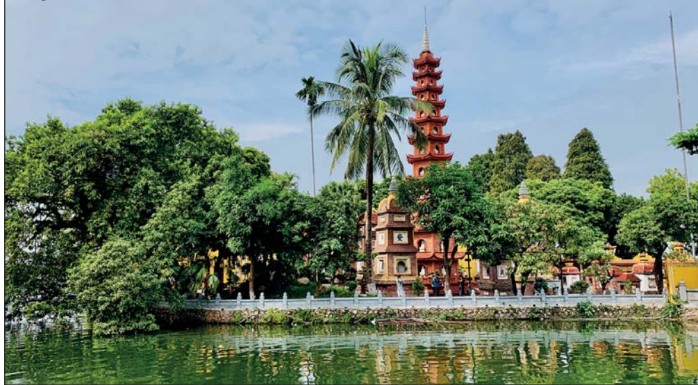
Pagoda Tran Quoc