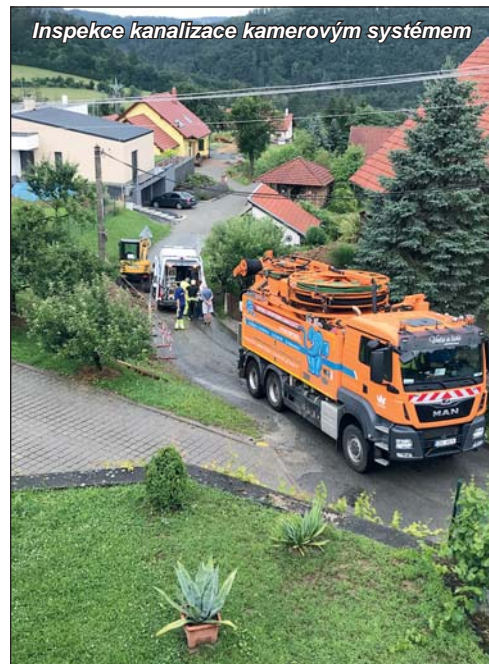
Inspekce kanalizace kamerovým systémem