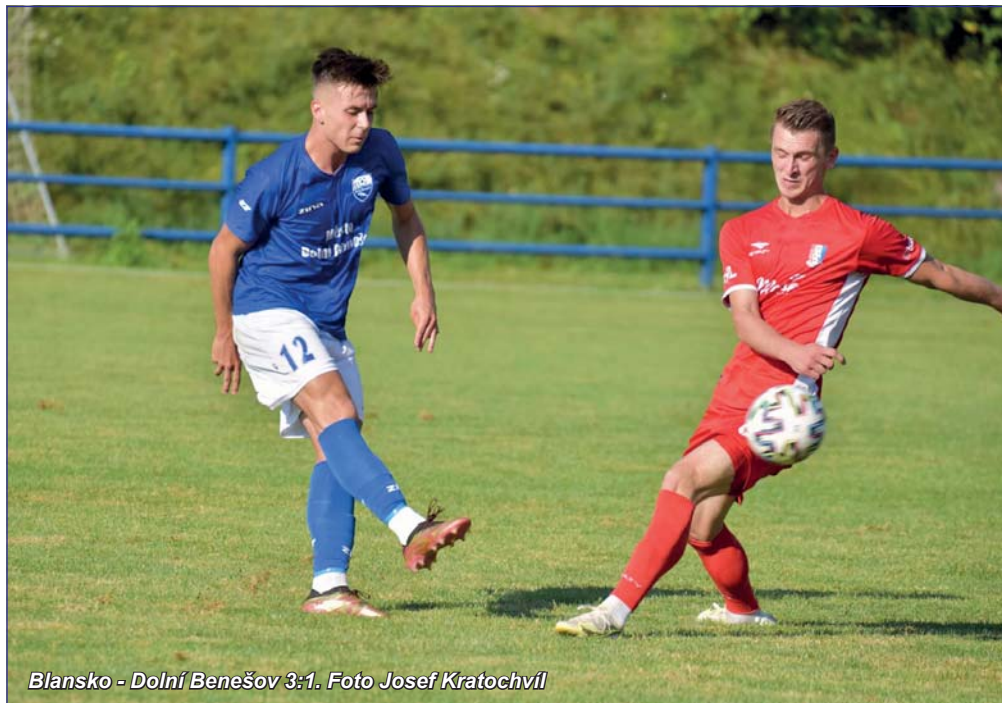
Blansko - Dolní Benešov 3:1.

Nečekaně příznivý pohled na pořadí MSFL po čtvrtém kole. Některými podceňovaně Blansko, které po sestupu z druhé ligy viděly škarohlídové v budoucnu až někde v krajském přeboru, je na špičce tabulky. Po smolné prohře gólem v nastavení v domácím úvodním utkání s Vratimovem naskočili svěřenci trenéra Petra Vašíčka na vítěznou vlnu a po drtivé výhře ve Znojmě se dívají na své protivníky pěkně z nejvyšší příčky tabulky