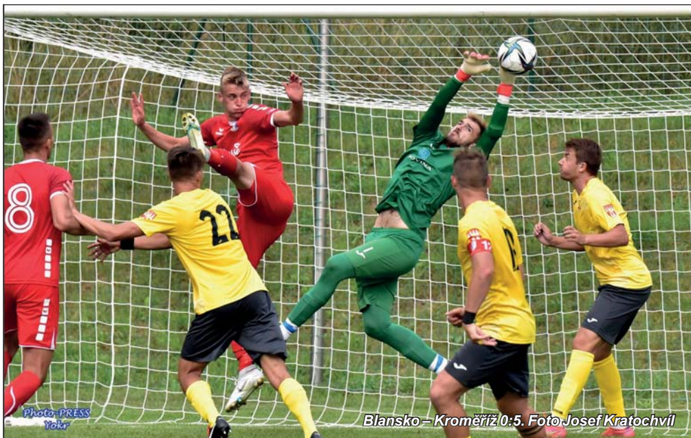
Blansko – Kroměříž 0:5.

Že domácí premiéra v novém ročníku moravskoslezské ligy nebude jednoduchá, se čekalo. Do Blanska přijel sebevědomý soupeř z Kroměříže, jeden z hlavních favoritů na postup, který zde při posledním utkání loňského ročníku nadělal domácím debakl 1:5. Situace se bohužel opakovala, tentokrát však domácí ani ten jeden gól nedali a znovu pět inkasovali. Svěřenci Petra Vašíčka přitom vyložené nepropadli, soupeř jim však udělil dokonalou lekci z produktivity.