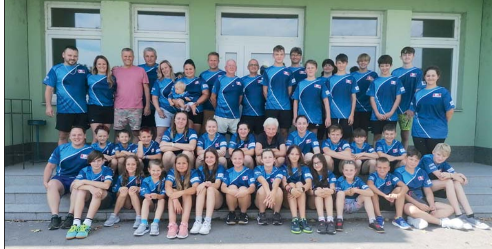
Účastníci soustředění ve Strážnici