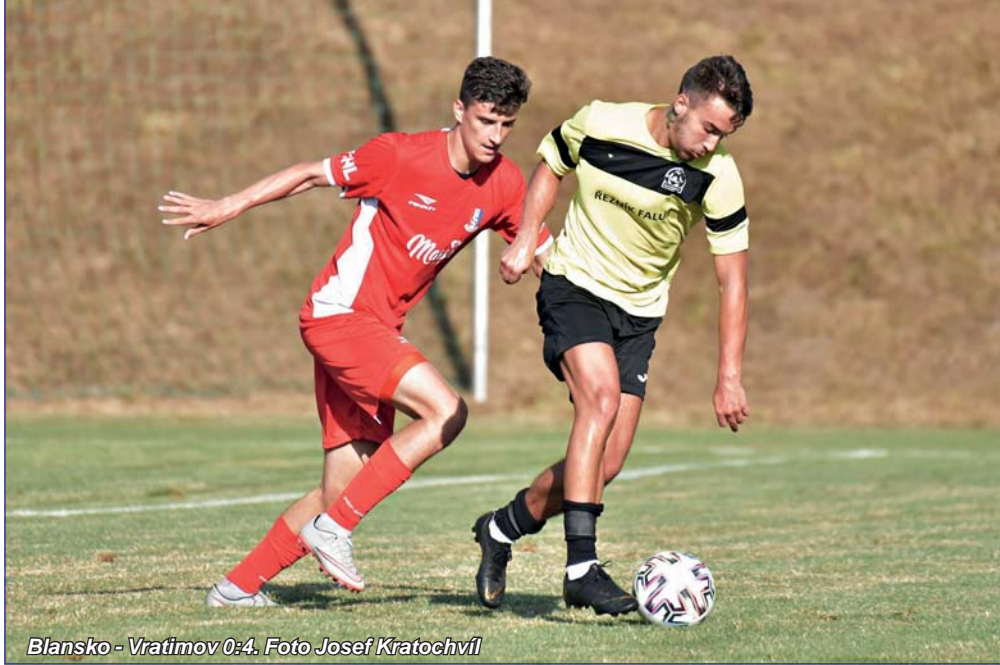
Blansko - Vratimov 0:4.

Tři body v tabulce po odehraných dvou kolech moravskoslezské fotbalové ligy. Jak k nim Blansko přišlo? V zápase s vyrovnaným průběhem proti nováčkoví soutěže z Vratimova již vše šlo k zasloužené remíze. Až v nastaveném čase ale po nepozornosti v obraně hosté gólem rozhodli o svém překvapivém vítězství. I v utkání v Jihlavě proti béčku ligového mužstva už to vypadalo na dělbou bodů. Tentokrát se však fotbalová štěstěna usmála na hráče Blanska, když v poslední minutě trefila zisk tří bodů posila z Lišně Reteno Elekana.