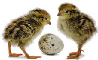
KŘEPELČÍ VAJÍČKA Z NEBESÍČKA +420 602 786 025

* Nabízím za odvoz hlínu, cca malý kontejner. Tel. 776073629.