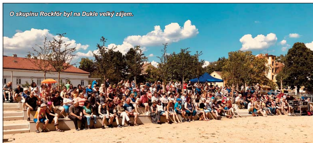
O skupinu Rockfór byl na Dukle velký zájem.

Strašně mě potěšil nebyvalý zájem o Letní Dukla festival. Série pěti koncertů, které se konají každou druhou neděli v parku po bývalém hotelu Dukla se velice slibně rozjela. Na první koncert HD acoustic se 1. července přišly podívat asi tři stovky posluchačů a nejinak tomu bylo i na druhém koncertu skupiny Rockfór 15. července. Festival tak střed města výrazně oživil. Pohodová atmosféra, slunce a muzika... Spokojení návštěvníci nešetří chválou. Jedna z pisatelek napsala na web blansko.cz: Dobrý den, chci poděkovat městu a především pak pořadatelům za zorganizování skvělého koncertu HD Acoustic. Músím říct, že se mi místo až do neděle opravdu nelíbilo. V neděli došlo k prozření a názor jsem změnila. Slunko, občerstvení a dobrá hudba přímo v centru města. Byla jsem moc překvapená a skvěle jsem si to užila.