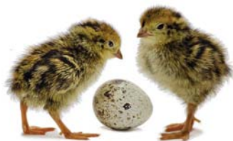
KŘEPELČÍ VAJÍČKA Z NEBESÍČKA

* Hledám někoho, kdo daruje starou plechovou petrolejku Meva, Tel. 737002332.