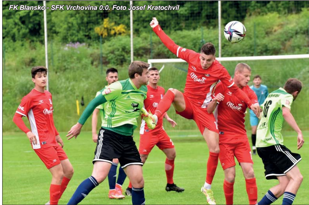
FK Blansko - SFK Vrchovina 0:0.

Neděle, středa, neděle. Takový byl zápasový program blanenských fotbalistů v moravskoslezské lize. Bohužel ani v něm svěřenci trenéra Petra Vašíčka nevystoupili ze svého jarního stínu, útlum pokračuje. Jen dva body za dvě remízy, pouhé dva vstřelené góly, to je chabá vizitka, jejímž důsledkem je třináctá příčka v tabulce. Drtivá domácí prohra s Kroměříží, bezbranková plichta se slaboučkou Vrchovinou a vydržený bod z Velkého Meziříčí. Strach z možného sestupu je sice zažehnan, nepříjemný pocit z výkonů týmu je ale ve vzduchu stále více citelný.