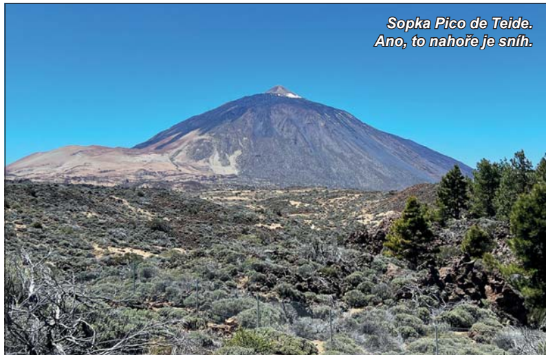
Sopka Pico de Teide. Ano, to nahoře je sníh.