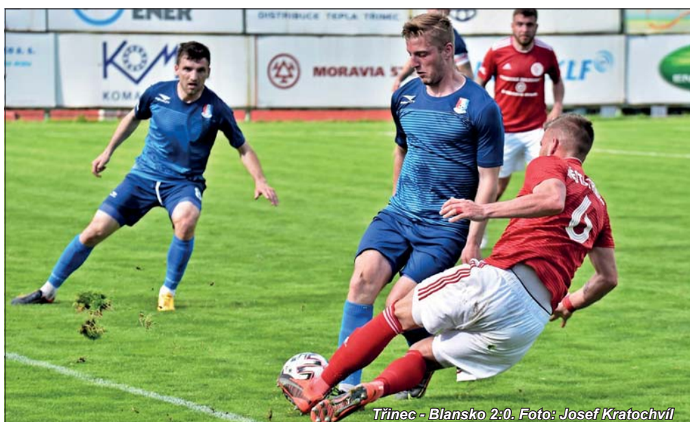
Třinec - Blansko 2:0.

FK Blansko – 1.FC Prostějov 2:1 (0:0). Branky: 87. Klusák, 90. Kep – 80. Koudelka. Blansko: Halouska – Klusák, Aggoun, Černín, Sedlo – Helebrand (74.