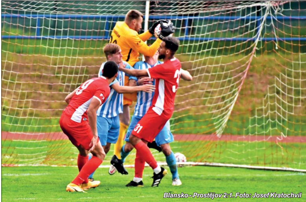
Blansko - Prostějov 2:1.

Blansko po ročním působení v druhé nejvyšší soutěži v ní končí. Již několik kol před koncem bylo totiž vedením oznámeno, že v dalším ročníku již z finančních důvodů nemůže pokračovat. Místní fanoušci to přijali mnohdy s nelibostí, na druhou stranu je nutno ocenit, že byly patrně správně odhadnuty budoucí síly a klub se rozhodl nepokračovat v nedostatečně zastřešené budoucnosti na profesionální bázi. Jak se nakonec ukázalo, sestup by nakonec byl dán i po závěrečném pohledu na tabulku, otázkou je, zda na týmu nebyla již znát ztráta motivace. Logicky. Jak by soutěž nakonec dopadla, nebýt této situace, je otázkou, o které se bude dál jen již polemizovat. Poslední dvě utkání se tak již jen „dohrávala“. V Třinci proti svěřencům legendárního kouče Františka Straky Blansko doplatilo na obdržené góly z prvního poločasu a padlo. Domácí loučení proti ambicióznímu Prostějovu však přineslo pak po dramatu v závěru závěrečnou druholigovou výhru.