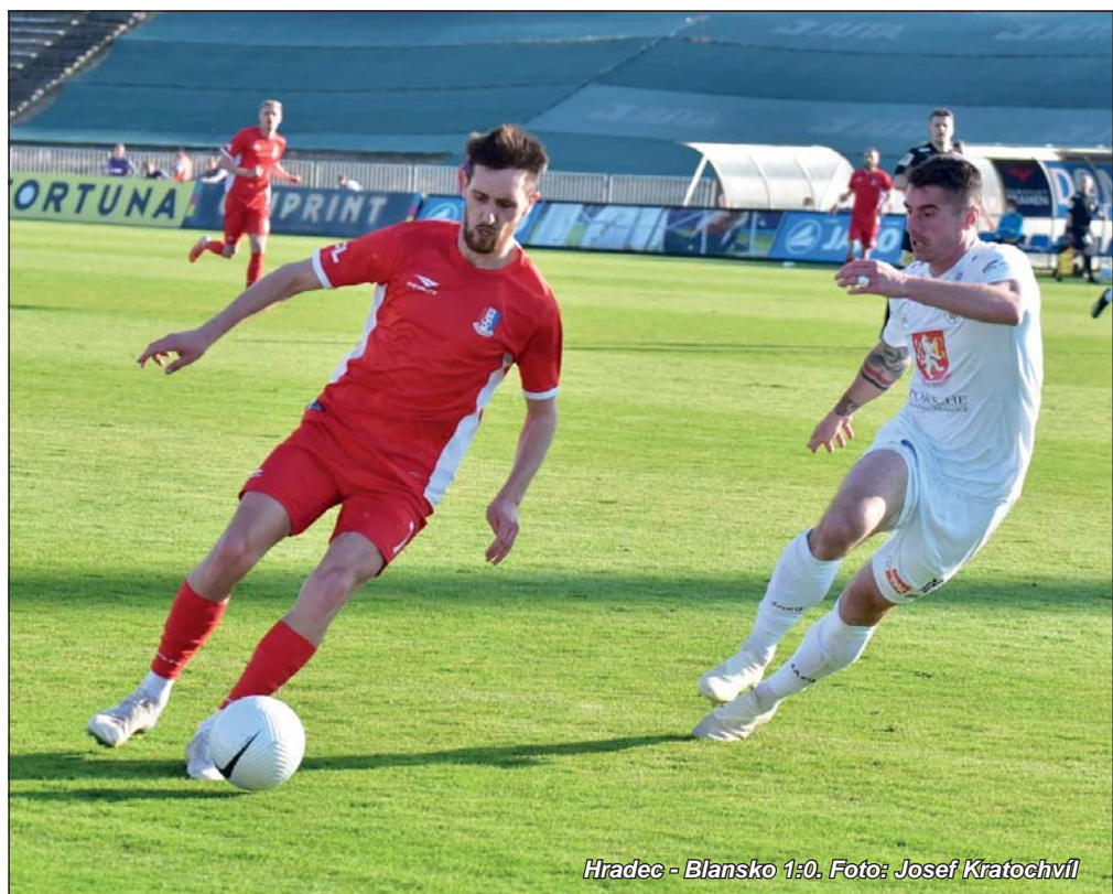
Hradec - Blansko 1:0.

Tato situace nás velice mrzí. I s ohledem na výkony hráčů jsme se snažili udělat maximum pro to,