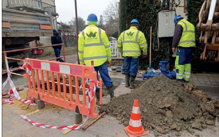
Oprava poruchy v Bořítově.