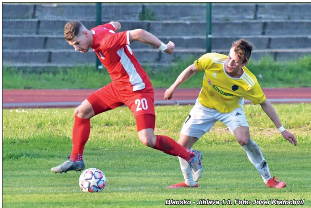
Blansko - Jihlava 1:3.

Poslední tři utkání blanenských fotbalistů nepřinesla žádný bodový zisk. Ač jarní část sezóny pro celek vedený ambiciózním trenérem Martinem Pulpitem začala velice slibně a tým pod jeho vedením sbíral body jak na běžícím pásu, vše se zadrhlo v posledních dvou týdnech. Po poměrně nešťastné prohře na Julisce v dohrávce utkání s pražskou Duklou, proběhla další dvě utkání, v nichž Blansko nedosáhlo na žádný bod. To, že souběžně proběhla tisková a internetová přestřelka ohledně dalšího působení klubu v druhé lize, mělo na určitě na atmosféru v kabině nepochybně vliv. Přesto lze na hru Pulpitových svěřenců stále nahlížet s uznáním. Jak bude vypadat ve zbytku jara, uvidíme v nejbližších dnech.