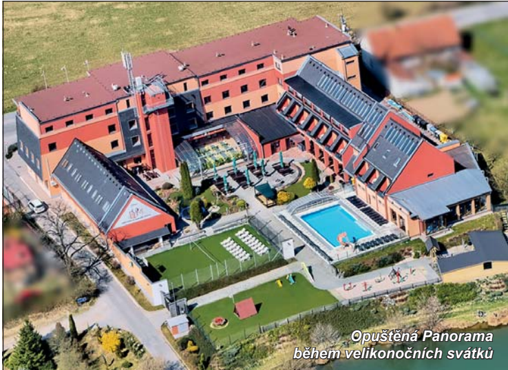
Opuštěná Panorama během velikonočních svátků

„Na půjčku jsme nedosáhli, ostatně jako většina kolegů z branže, a do dnešního dne jsme nic od státu nedostali. V existenčních potížích zatím nejsme, ale museli jsme do firmy vložit finance na nutný výdaje. Lidé moc našich služeb nevyužívají, ale díky za každý prodaný oběd. Ale jsou i tací, co nás chtějí