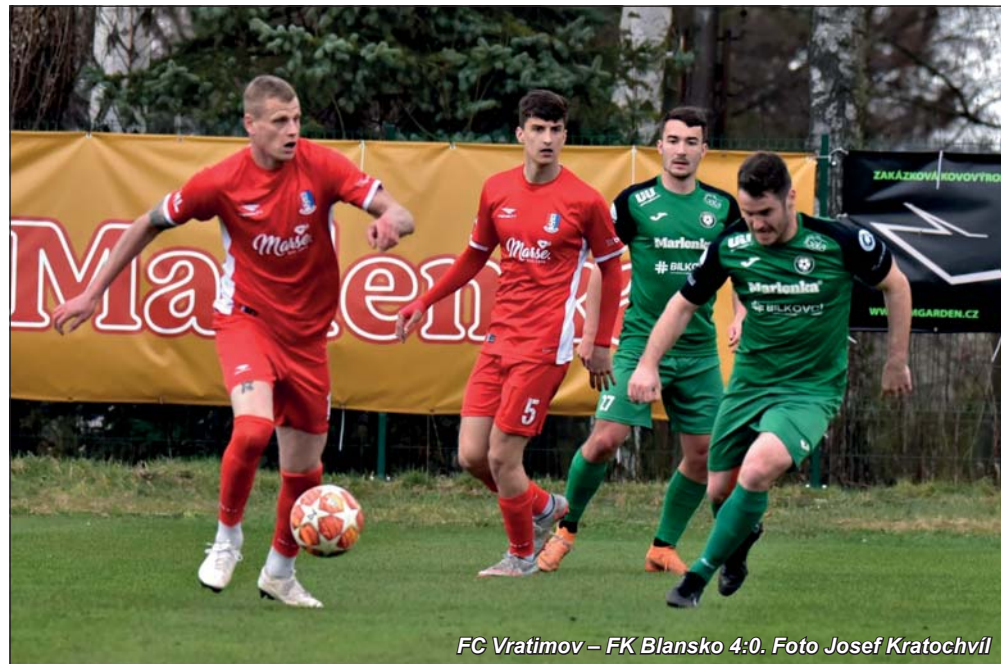
FC Vratimov – FK Blansko 4:0.

První jarní kolo přineslo Blanenským nečekanou pauzu, protože se jejich duel s Vratimovem neuskutečnil pro nezpůsobilý terén na hřišti soupeře. Do dohrávky odcestovali svěřenci trenéra Petra Vašíčka s přáním pomstít se za porážku ze startu podzimu, v němž doma s tímto soupeřem prohráli nešťastným gólem v nastavení. To se jim ale vůbec nepovedlo, naopak si z Ostravská přivezli drtivou porážku.