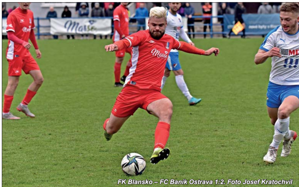
FK Blansko – FC Baník Ostrava 1:2.

Střední dohrávka s Vratimovem měla tým vzhledem k drtivé porážce se Znojmem nabudit ke snaze o napravení reputace. Mužstvo do ní totiž odjždělo s optimistickou představou o bodech zvenku. Přišla krutá sprcha. A následoval duel s ambiciózními mladíky z béčka ostravského Baníku, žádná vábná volba. Přišla další porážka, i když tentokrát se vztyčenější hlavou. Do zápasu s béčkem dalšího prvoligového celku do Starého Města šli Blanenští znovu se snahou o body. Podařilo se získat jeden, sice až v samotném závěru, ale možná o to cennější vzhledem k povzbuzení psychiky týmu.