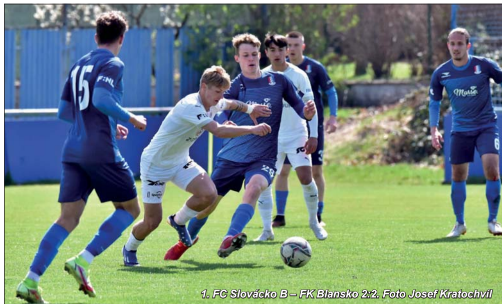
1. FC Slovácko B – FK Blansko 2:2.