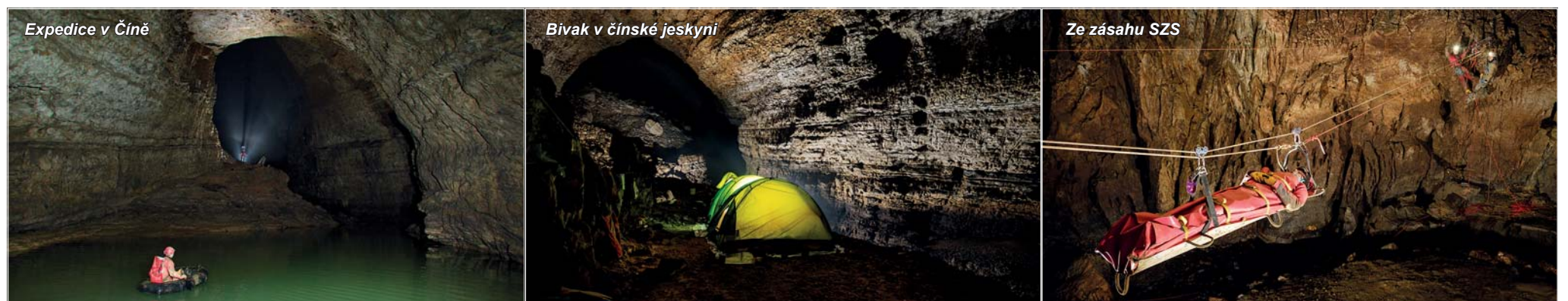
Expedice v Číně