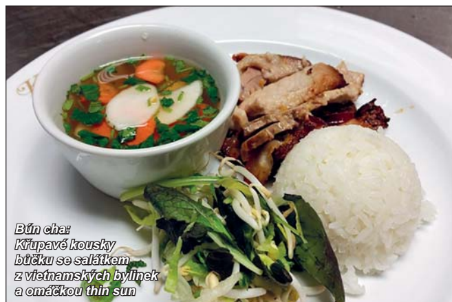
Bún cha Křupavé kousky bůčku se salátkem z vietnamských bylinek a omáčkou thin sun