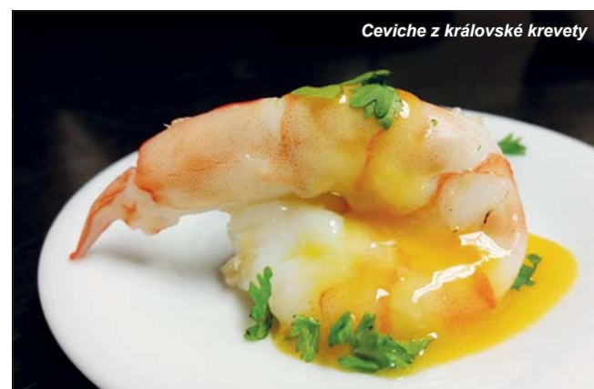
Ceviche z královské krevety

Hlavní chody jsme ochutnali hned tři: Tandoori masala, Bún cha a kuře Vindaloo. Indické koření tandoori je založené na hřebíčku, kardamomu, zázvoru a mnoha dalších ingrediencích, dohromady dává skutečně exotickou směs, jenž se používá v Indii a Pákistánu. Tandoori se dělá v nespočetném množství různých variací. My ochutnali kombinaci koření, vepřového masa, kokosového mléka, rajčat a