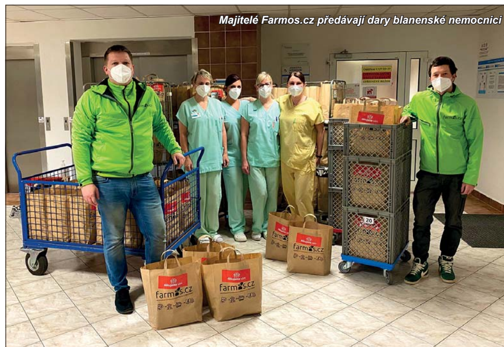
Majitelé Farnos.cz předávají dary blanenské nemocnici