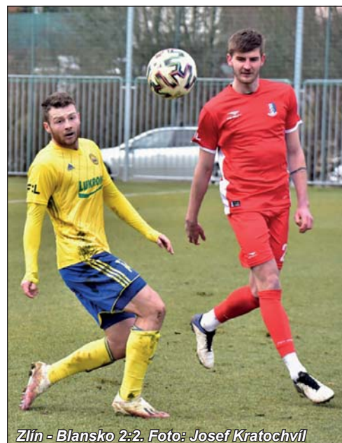
Zlín - Blansko 2:2.