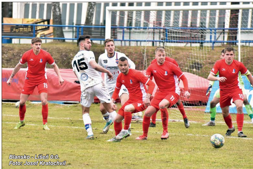
Blansko - Líšeň 0:0.

Brzký dopolední začáteční čas derby s Líšní přinesl slunečné počasí. Nevydrželo dlouho. Zatahlo se a začal foukat nepříjemný studený vítr. Ten nakonec v duelu zachraňujícího se Blanska s vedoucím týmem soutěže gól nepřivál ani na jednu stranu. V bojovném utkání, kde nebylo žádných stoprocentních šancí, mohla rozhodnout náhodná branka na jedné či druhé straně. Ti, kteří by ho dali, by se radovali, smutnili by ti druzí. Jindy vrtkavá štěstěna byla tentokrát spravedlivá, bod si zasloužili oba soupeři.