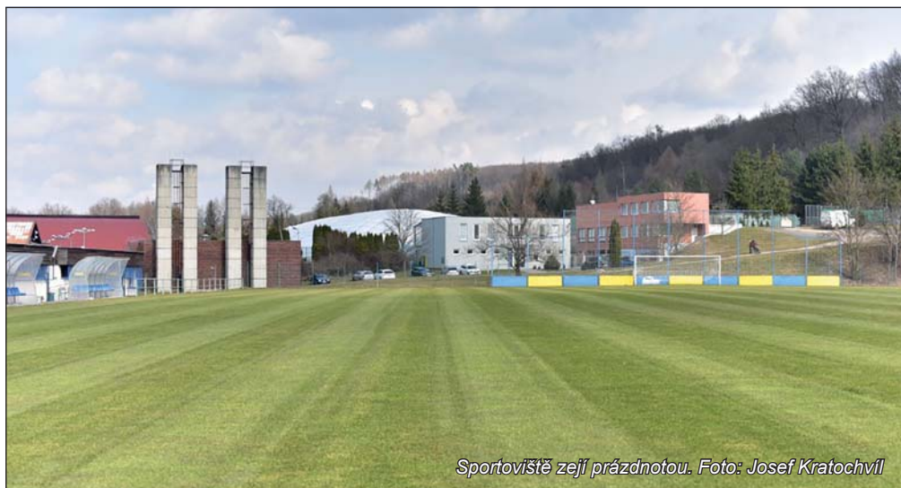
Sportoviště zejí prázdnotou.

Máme za sebou rok prožitý v jakémsi černém snu. Určitě nejsem sám, kdo si přál se z něho už konečně probudit. A svět kolem aby byl takový jako dřív. Ne, že jsme žili v kdovíjak úžasné době. Svět se kamsi podivně řítí i bez toho čínského viru, který ochromil celý svět. Teď si s úsměvem vzpomínáme, jaké jsme řešili problémy. Třeba kde je záplava migrantů, kde zelená Greta? Nezmizeli, ale upozadili se, řešíme teď něco úplně jiného. Jde o životy, umírají lidé z nejbližšího okolí na něco, co tu nebylo. A vše, co pandemie přináší, je čím dál hrozivější. Televize, noviny, internet stále chrlí další a další děsivé zprávy, lidstvo se kamsi řítí. A hlavně co důsledky, které nás ještě čekají a které zatím dokážeme jen předjímat... Nic už nebude jako dřív? Tento názor stále více převládá. Ale smíříme se s tím opravdu?