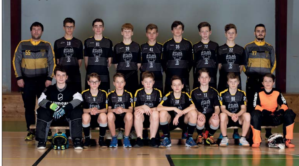
Florbalový tým starších žáků

ve dvou je možnost trénování velmi omezená, skoro až nemožná. Nejde jen o pohyb samotný, ale i o vytváření sociálních vazeb mezi hráči.