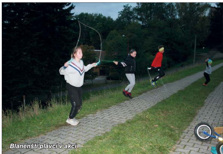
Blanenští plavci v akci

Teď díky omezením moc možností něco dělat nemáme. Snažili jsme se děti motivovat různými individuálními sportovními výzvami přes sociální sítě, sdíleli videa a přednášky hokejového svazu, to se ale s funkcí kolektivního sportu nedá srovnat.