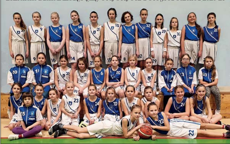
Blanenské basketbalistky: týmy U10, U11, U12 a U13 před sezonou 2020-21

jíž začal trápit nedostatek tréninkových hodin našich pěti družstev zařazených v soutěžích. Největším problémem loňského roku nebyl ani tak problém zastavení soutěží, ale možnost se setkávat ve vnitřních prostorách. Nakonec jsme trénovali dle nařízení venku po šesti hráčích. Bylo to provizorium, ale nějaké východisko z dané situace to bylo. Avšak naprosto nesmyslné bylo zakázat pohyb dětem venku úplně. Abychom udrželi děti v rámci možností aktivní, děláme aktivity on-line. Časový průběh je naznačen pro názornost v boxu.