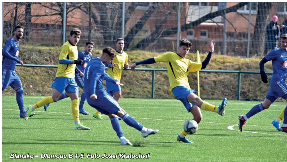
Blansko – Olomouc B 1:5

Domácí celek nastoupil do utkání proti rezervě prvoligové Sigmy Olomouc v žlutomodré kombinaci, kterou chtěli podpořit svého spoluhráče ukrajinského původu Jiřího Tulajdana, který má v zemi ohrožené ruskými okupanty rodinu. Výsledek generálky na hřišti ale příliš nepřesvědčil.