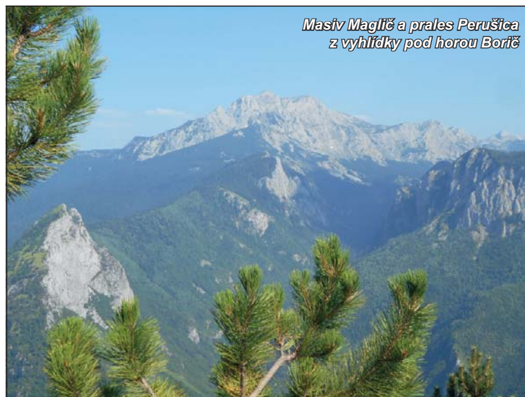
Masiv Maglić a pralesa Perušica z vyhlídky pod horou Borič

Naše dva manželské páry ve věku 58 až 64 let, se velmi dobře znají, a proto jezdí rády na společnou letní dovolenou. Ideálním místem pro naše letní putování je hornaté vnitrozemí Balkánského poloostrova. Tato krajina je divoce krásná a z České republiky je autem lehce dosažitelná.