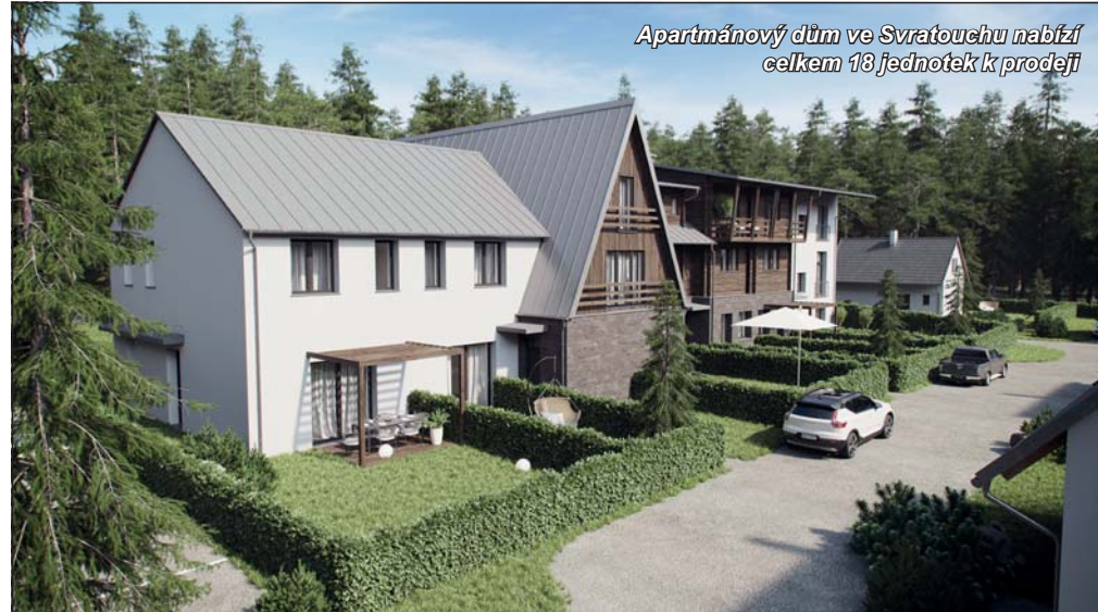
Apartmánový dům ve Svratouchu nabízí celkem 18 jednotek k prodeji

Společnost PROPERITY se za 22 let stabilního působení na trhu s nemovitostmi řadí mezi přední developerské společnosti v Brně a okolí. Za sebou má více než čtyři desítky projektů, mezi nimiž najdete i unikátní významem přesahující hranice krajského města. Z významných projektů můžeme zmínit AZ Tower, jakožto současnou nejvyšší budovu v ČR, dřívější nejvyšší bytový dům v Brně – Komplex Eden, nebo čerstvě oceněný realitní projekt roku 2021 v Jihomoravském kraji – Dům Hippokrates.