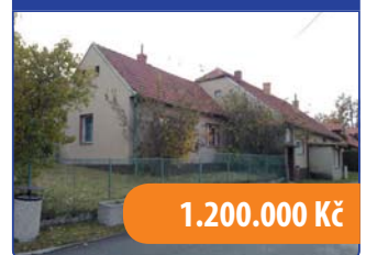
Venkovské stavení Ludíkov