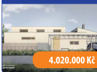
Novostavba 5+kk Sebranice