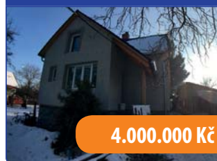
RD 4+kk Svitávka