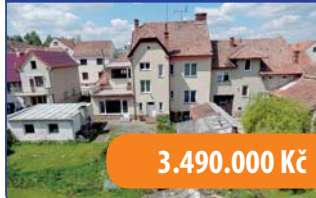
Prvorepubliková vila Černá Hora