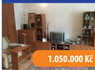
Byt 1+1 Boskovice