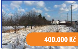
Stavební pozemek 801 m 2 Sebranice