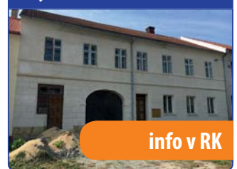
Stylová usedlost Vanovice