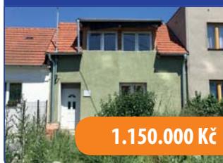
RD 3+1 Drnovice