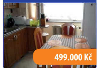
Byt 3+1 Křtěnov