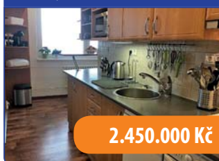
Byt 3+1 Boskovice