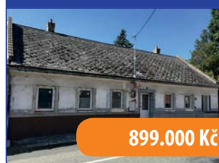
RD (1+1 a 2+kk) Kunštát