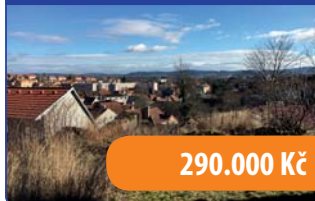
Pozemek s projektem na RD Velké Opatovice 697 m 2