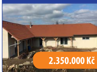
RD Paměťice 4+kk