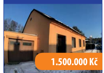
RD 3+1 Boskovice