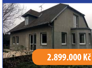
Novostavba 3+1 Kostelec