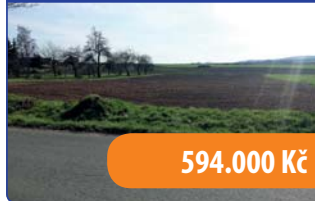
Stavební pozemek 2700 m 2 Cetkovice