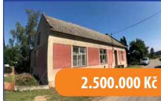
RD s velkým pozemkem Vavřinec