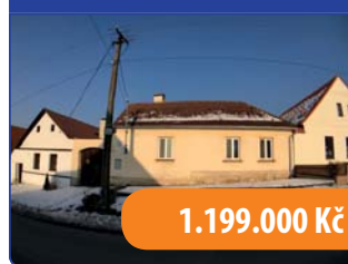
RD 2+1 Šebetov