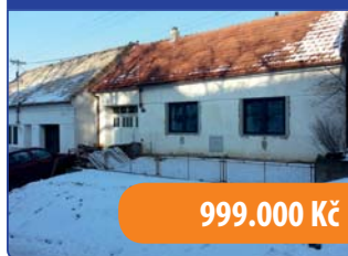
RD 3+1 Věteřov

"Při prodeji vaší nemovitosti zůročím dlouholeté obchodní dovednosti a získané kontakty."