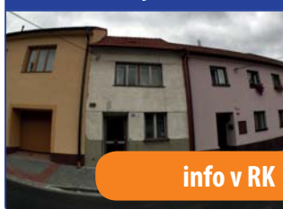
RD 3+1 Rájec-Jestřebí