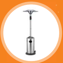
PLYNOVÝ ZÁŘIČ cena od 600 Kč/den