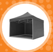
NŮŽKOVÝ STAN cena od 1.400 Kč/den

www.teamagency.cz/pronajem tel.: 608 789 789