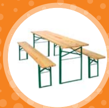
PIVNÍ SET cena od 250 Kč/den