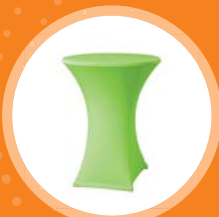
BISTRO STOLEK cena od 200 Kč/den