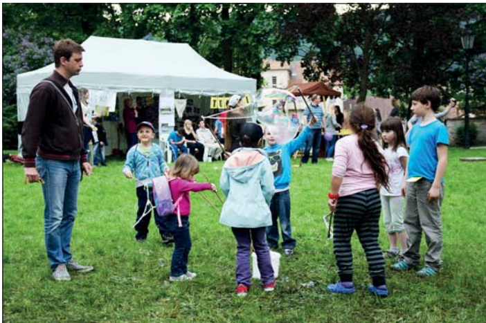
BAMBIFEST 2016.

Předně přišlo opět více lidí, a to jak na denní program ukázek volnočasových aktivit, tak na večerní festival začínajících a mladých kapel. Zúčastnil se i vyšší počet organizací. V tomto má BAMBIFEST stále vzrůstající tendenci. Vydařilo se toho více.