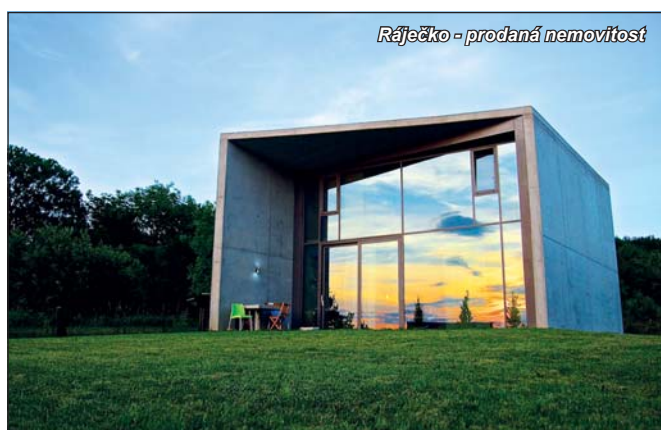
Ráječko - prodaná nemovitost

Společnost TAJOVSKÝ reality s.r.o. poskytuje služby související s prodejem, koupí a pronájmem nemovitostí. Činnost naší kanceláře je ale mnohem širší, nejde jen o prodej nemovitostí, z naší strany jde hlavně o rychlé vyřízení a celkový komfort pro naše zákazníky. Každému klientovi poskytneme plně individuální přístup, dle jeho potřeb a možností. Vy prodáváte a my se staráme o to, abyste kromě podpisu nemuseli cokoli dalšího řešit.