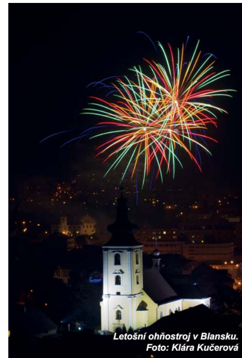
Letošní ohňostroj v Blansku.