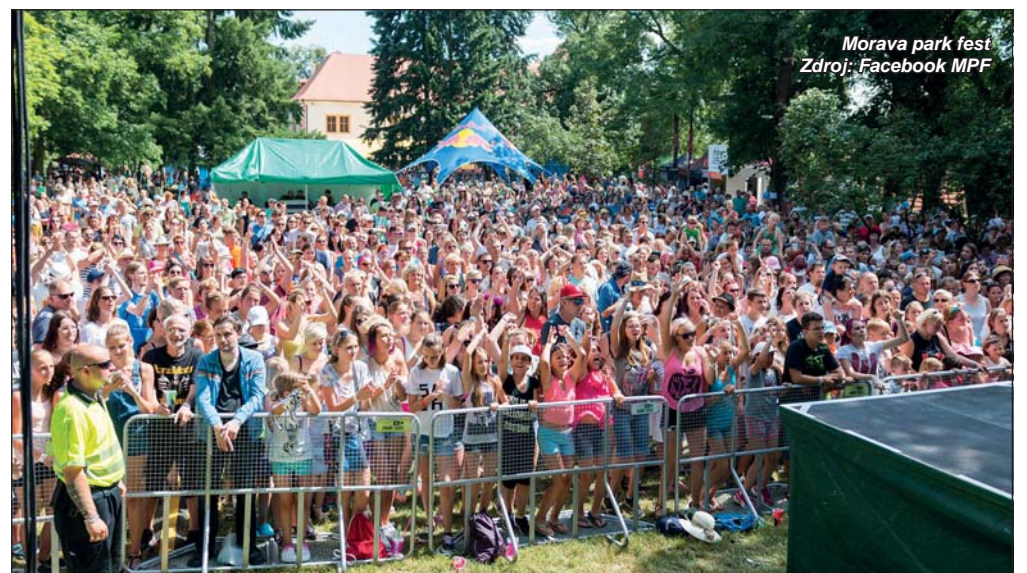
Morava park fest

Od začátku nového roku platí v Blansku nová vyhláška o vymezení zkrácené doby nočního klidu. Zastupitelstvo ji schválilo na zasedání konaném 13. prosince 2016. Jde o konkrétní termíny, kdy se každoročně pořádají tradiční městské akce většího rozsahu.